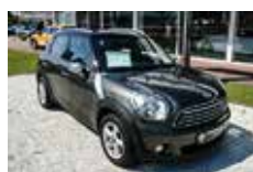
MINI Cooper Countryman | 15.440 EUR

EZ 02/2015, 6.772 km, Diesel, 190 kW (258 PS), Automatik, Weiß, Leder beige, Lichtpaket, Scheinwerfer-Waschanlage, Adaptiver LED-Scheinwerfer, Sport-Lederlenkrad, Sitzheizung, Komfortzugang, Interieur Edelholzausführung, Klimaautomatik, PDC, Teleservices, Dachreling, Freisprecheinrichtung, 19" LM Räder Y-Speiche