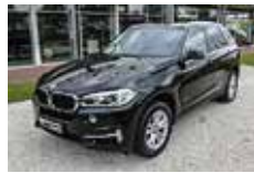
BMW X5 xDrive30d | 65.990 EUR

EZ 11/2011, 47.800 km, Diesel, 135 kW (184 PS), Schwarzmetallic, Leder beige, M-Leder-Sportlenkrad, Klimaautomatik, beheizb. Sportsitze, M-Sportpaket, Sportfahrwerk, Navi, MP3, Dachreling, LM-Räder, Xenon, LED hinten, HiFi, M-Aerodynamikpaket, CD, Freisprech., Bluetooth, Tempomat, PDC vorn/hinten, Regensensor,