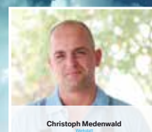
Christoph Medenwald Werkstatt