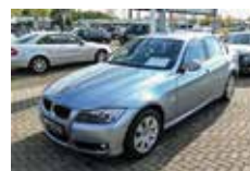
BMW 318i Limousine | 13.990 EUR

EZ 02/2012, 50.120 km, 100 kW (136 PS), graumetallic, Sport-Line, Comfort Paket, Sichtp., Ablagenpaket, Lichtpaket, Fahrkomfort Paket, DSC, M-Sportfahrwerk, PDC, Regensensor, el. FH, Klimaautom., Multifunkt.-Sport-Lederlenkrad, Sitzheizung, Rückfahrkamera, Navi, Sportsitze, HiFi, Freisprech., el. Glasdach, 16"LM-Räder