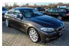
BMW 525d Limousine | 22.620 EUR

EZ 07/2010, 65.049 km, Diesel, 150 kW (204 PS), Schwarzmetallic, Leder, Adaptives Kurvenlicht, Navigationssystem Professional, Comfort-Paket, Komfortzugang, LM-Felgen, Mittelarmlehne vorn verstellbar, PDC vorn und hinten, Raucher-Paket, Klimaautomatik, Multifunktionslenkrad, Tempomat,