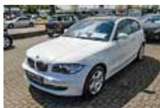
BMW 116i 3-Türer | 10.925 EUR

EZ 01/2009, 62.500 km, 90 kW (122 PS), Weiß, Ablagenpaket, Advantage Paket, DSC, Nebelscheinwerfer, Auto Start/Stop Funktion, Brake Energy Regeneration, Klimaautomatik, Sport-Lederlenkrad, PDC, Bordcomputer, Aux-In-Anschluß, Leichtmetallräder, CD-Spieler, elektr. Fensterheber, Traktionskontrolle