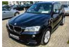
BMW X3 xDrive 20d | 32.840 EUR

EZ 06/2010, 136.420 km, Diesel, 150 kW (204 PS), Automatik, Havana Metallic, Leder beige, Xenon, Scheinwerfer-Waschanlage, Komfortsitze, el. Sitzverstellung, Sitzheizung, Edelholzausführung, Klimaautomatik, Sport-Lederlenkrad, el. Glasdach, PDC, CD-Player MP3-fähig, Bereifung mit Notlaufteig. LM-Räder V-Speiche