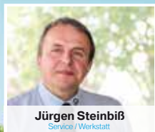
Jürgen Steinbiß Service / Werkstatt