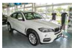
BMW X6 xDrive30d | 63.990 EUR

EZ 07/2014, 6.225 km, Diesel, 190 kW (258 PS), Automatik, Schwarzmetallic, Leder Schw., Xenon, PDC, Regensensor, LED-NS, Navi Pro, Standheizung, Sport-Multifunkt.-Lenkrad, HiFi, Komfortsitze, Sitzheizung, Klimaautom., Head-Up Display, Rückfahrkamera, Komforttelefonie, Dachreling, Anhängerkupplung, 18" LM-Räder