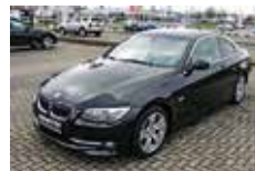
BMW 325d Coupe | 21.900 EUR

EZ 03/2009, 88.510 km, 105 kW (143 PS), Blaumetallic, Ablagenpaket, Comfort Paket, Auto Start/Stop Funktion, Brake Energy, Regeneration, Regensensor, Durchladesystem, Sitzheizung, Klimaautomatik, PDC, BC, Anhängerkupplung, Bereifung mit Notlaufesigenschaften, Servotronic, Radio BMW Professional