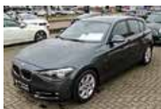
BMW 116i 5-Türer | 19.990 EUR

EZ 01/2009, 62.500 km, 90 kW (122 PS), Weiß, Ablagenpaket, Advantage Paket, DSC, Nebelscheinwerfer, Auto Start/Stop Funktion, Brake Energy Regeneration, Klimaautomatik, Sport-Lederlenkrad, PDC, Bordcomputer, Aux-In-Anschluß, Leichtmetallräder, CD-Spieler, elektr. Fensterheber, Traktionskontrolle